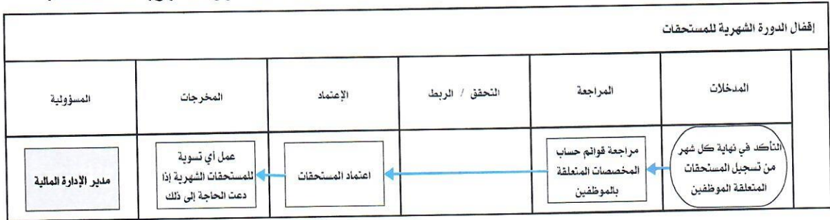
شكل رقم / ٥

يوضح المخطط البياني التالي ( شكل رقم/٥) طريقة تسلسل العمل لإقفال الدورة الشهرية للمستحقات: